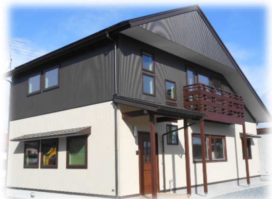
H25年度 ネットゼロエネルギー住宅支援事業採択

太陽光発電システム: CIS太陽電池 4.08kW 熱損失係数Q値: 0.83W/㎡・K