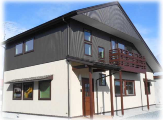
H25年度 ネットゼロエネルギー住宅支援事業採択

太陽光発電システム: CIS太陽電池 4.08kW 熱損失係数Q値: 0.83W/㎡・K 外皮平均熱貫流率UA値: 0.33W/(㎡・K)