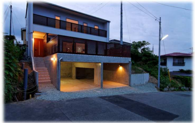
H26年度 住宅のゼロエネルギー化推進事業採択

太陽光発電システム: CIS太陽電池 4.08kW 熱損失係数Q値: 0.83W/㎡・K 外皮平均熱貫流率UA値: 0.33W/(㎡・K)