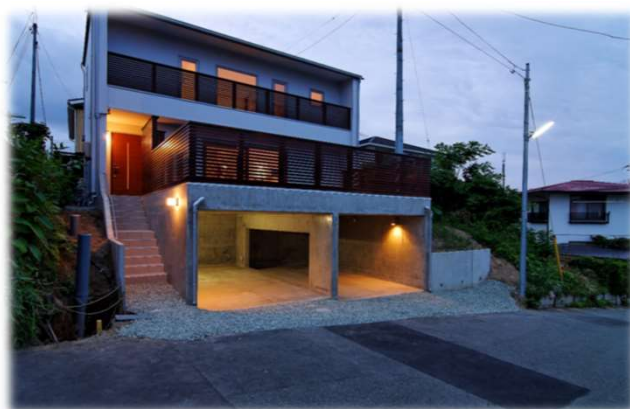
H26年度 住宅のゼロエネルギー化推進事業採択

太陽光発電システム: CIS太陽電池 4.08kW 熱損失係数Q値: 0.83W/㎡・K 外皮平均熱貫流率UA値: 0.33W/(㎡・K)